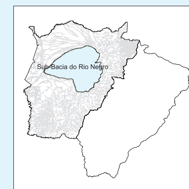
Figura 26. Níveis da qualidade das águas superficiais da sub-bacia do rio Negro, 2003.